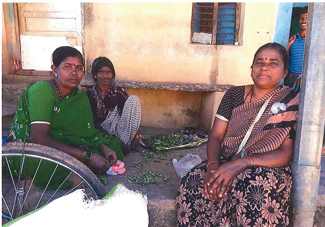
Invånare i byn Arebommanahalli

Likvida medel uppgick till 97,9 (123,3) MSEK den 31 december 2017.