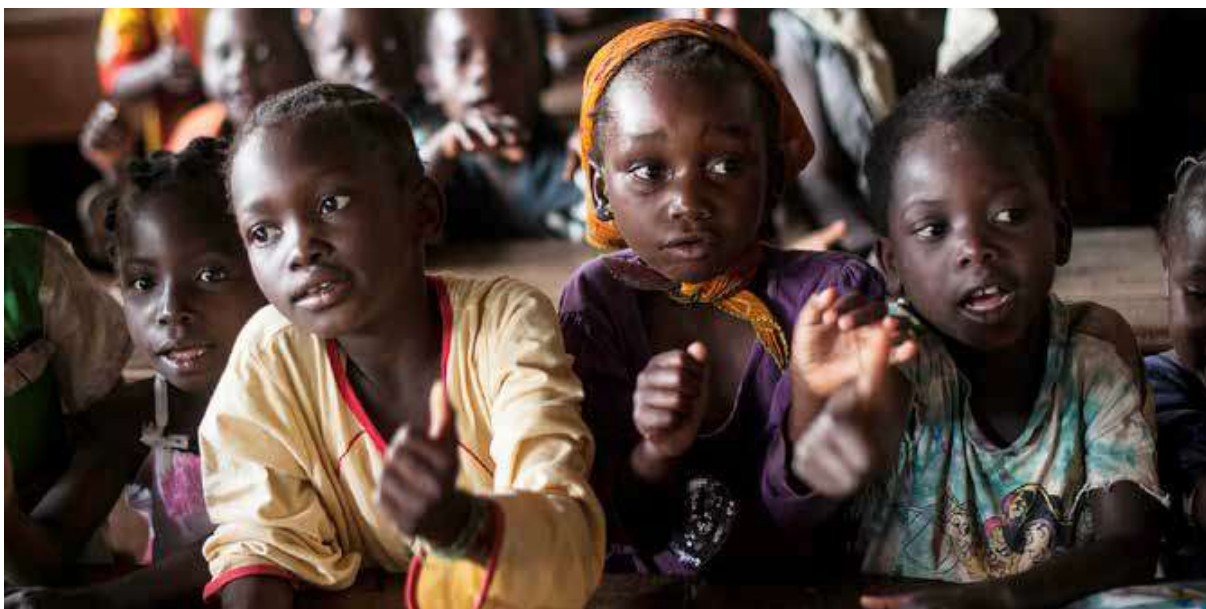
Fotografi från SOS Barnbyar

GoodCause har stöttat SOS Barnbyar sedan starten 2005 och har utöver Centralafrikanska republiken bidragit till deras arbete i Burundi, Senegal, Ghana och Moçambique. Exklusive årets utdelning avseende verksamhetsår 2015 har SOS Barnbyar fått 15,1 MSEK från GoodCause kunder.