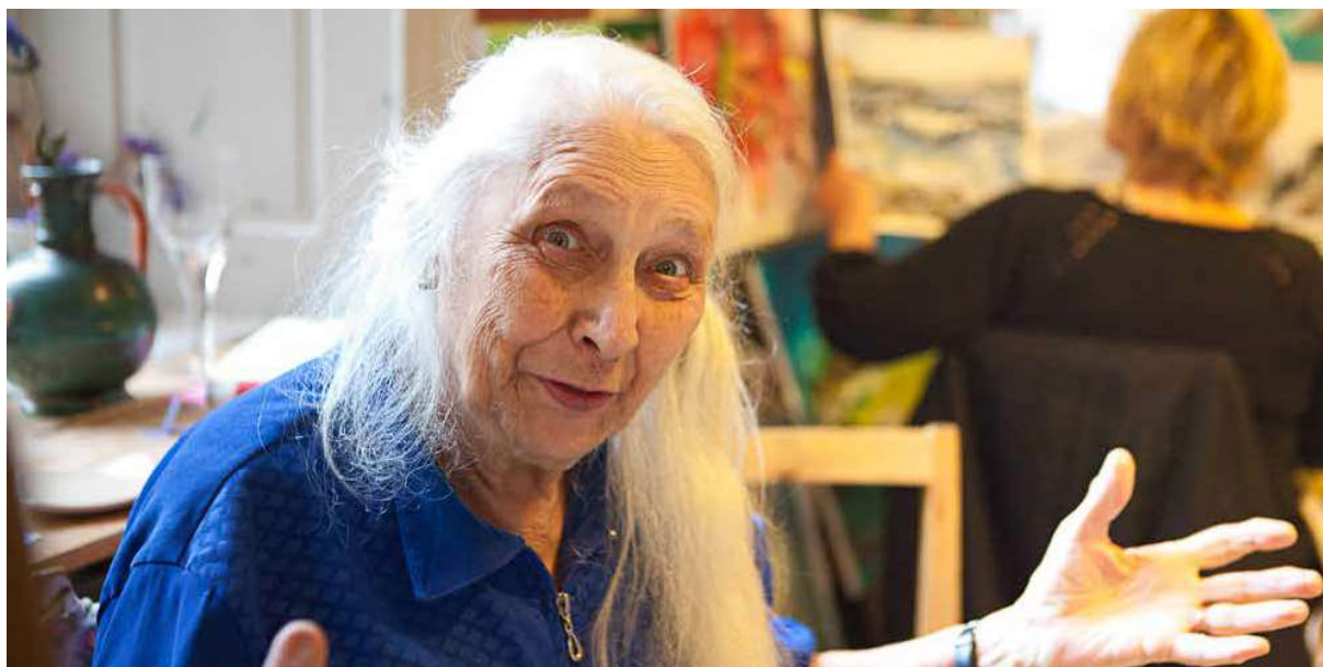
Fotografi från Stockholms Stadsmission

GoodCause har stöttat Stockholms Stadsmission sedan 2005. Exklusive årets utdelning avseende verksamhetsår 2015 har Stockholms Stadsmission fått 4,7 MSEK från GoodCause kunder.